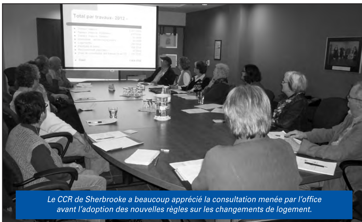
La CCR de Sherbrooke a beaucoup apprécié la consultation menée par l'office avant l'adoption des nouvelles règles sur les changements de logement.

À défaut d'offrir un transfert « au désir » à l'ensemble de leurs locataires, certains offices ont accepté de dresser une liste des moins bons logements, par exemple les studios, les sous-sol, etc., pour lesquels les changements seront autorisés après quelques années. C'est notamment le cas à Drummondville.